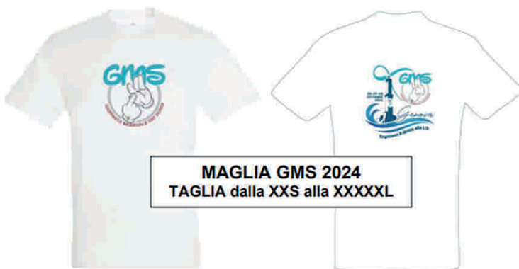
MAGLIA GMS 2024 TAGLIA dalla XXS alla XXXXXL