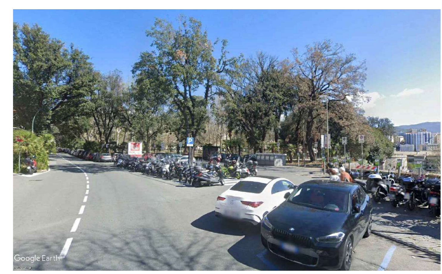
Vista F01 - Cantiere Base