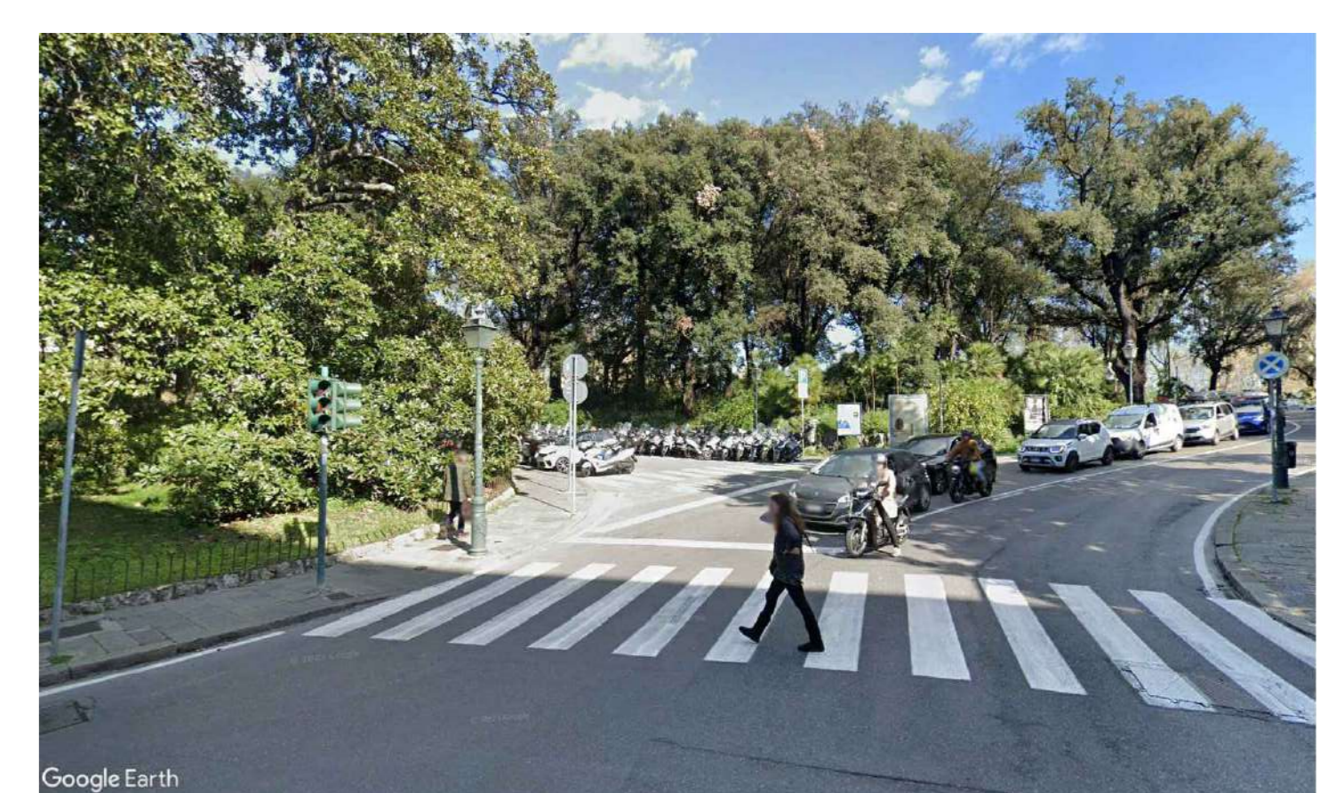
Vista F03 - Cantiere Operativo: Ingresso "Collo d'oca" via IV Novembre