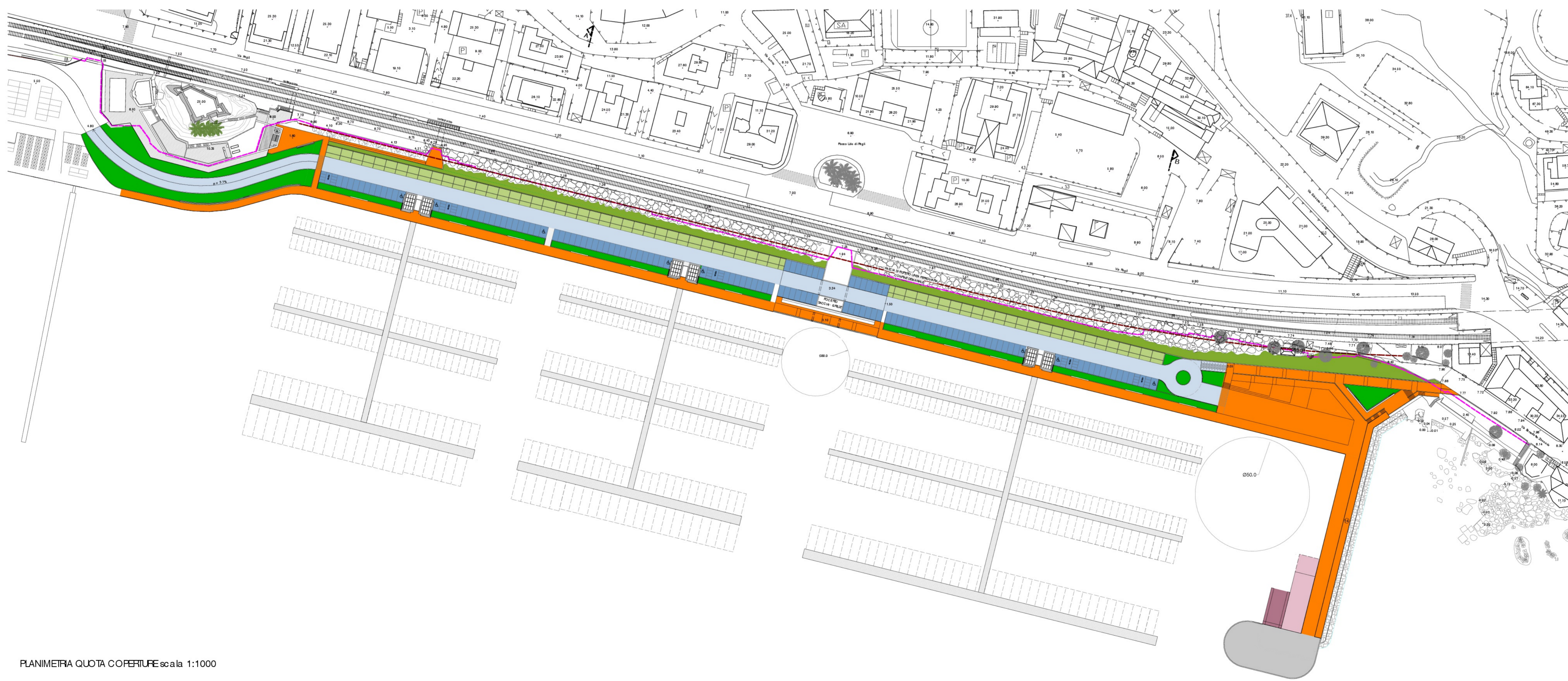
PLANIMETRIA QUOTA COPERTURE scala 1:1000