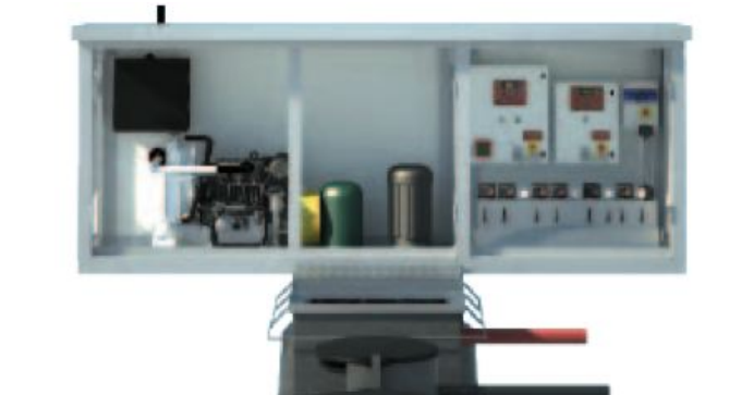
ARMADIO DI COMANDO VVFF