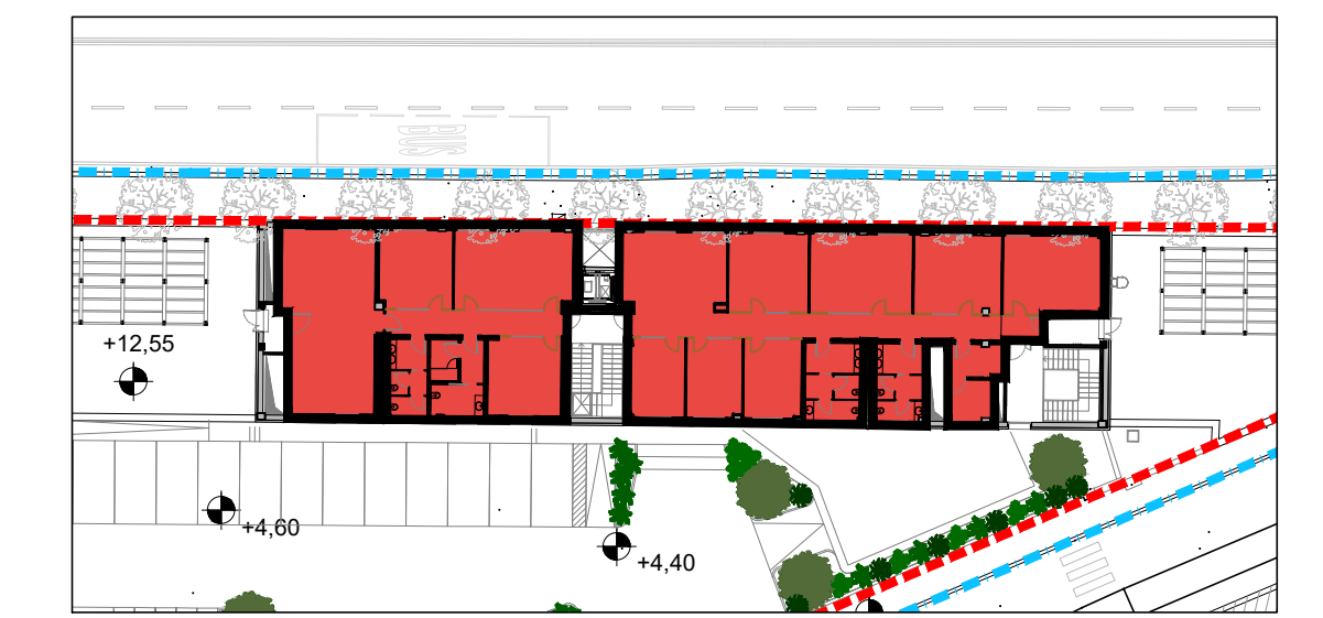
PLANIMETRIA PIANO SECONDO COMPARTO B