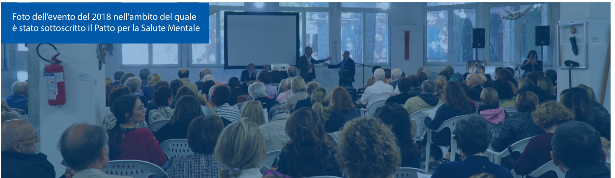
Foto dell'evento del 2018 nell'ambito del quale è stato sottoscritto il Patto per la Salute Mentale