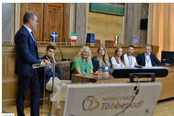
Un momento della conferenza con il panel degli esperti.

BETTER ha rappresentato un'occasione unica per condividere a livello internazionale i risultati del lavoro svolto dal Comune di Genova per migliorare i servizi offerti e, di conseguenza, migliorare il legame con i cittadini. L'obiettivo della conferenza finale è quello di condividere i risultati progettuali e le esperienze della governance locale, ma il vero scopo è ancora più ambizioso: trasformare in realtà lo spirito del programma, che mira non solo a riempire le lacune dello sviluppo regionale a livello europeo, ma anche a creare una rete di esperienze umane e di vita, nella prospettiva di un'Europa dei cittadini e per i cittadini.