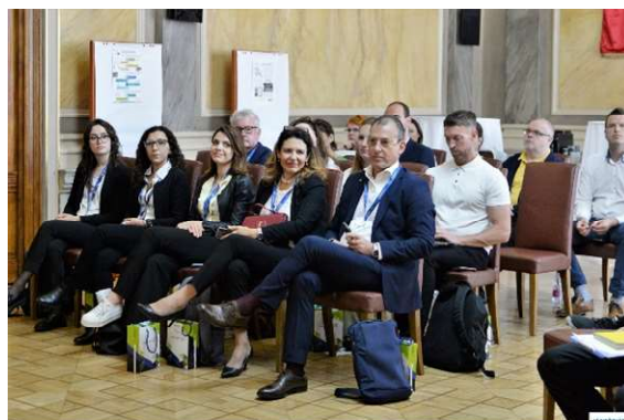
La delegazione del Comune di Genova

Dopo quattro anni di lavoro, si sono concluse le attività del progetto Interreg Europe 2014-2020 “BETTER”, lanciato nel 2019. Lo scorso 22 maggio 2023, la sala Krudy Hall del Municipio di Nyíregyháza (HU) ha ospitato la conferenza finale, dove i rappresentanti delle cinque città partner (Comune di Genova come Leader Partner, Birmingham City Council [UK], Comune di Gavle [SE], Comune di Tartu [EE] e Comune di Nyíregyháza - HU) si sono riuniti per un’ultima volta per condividere e scambiare esperienze sulle best practice comuni nel campo della e-governance.