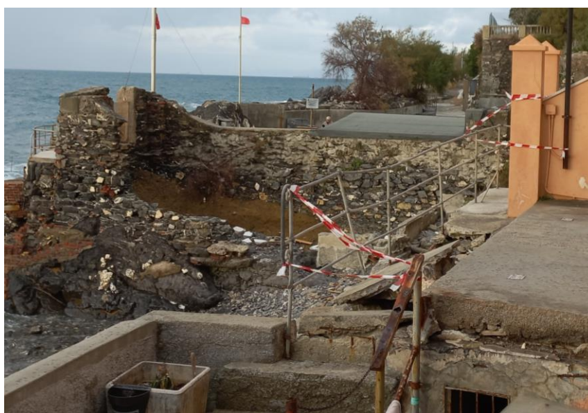
Figura 2: FOTO AREE ESTERNE SOGGETTE A TEMPORANEA INTERDIZIONE CON DIVIETO DI ACCESSO