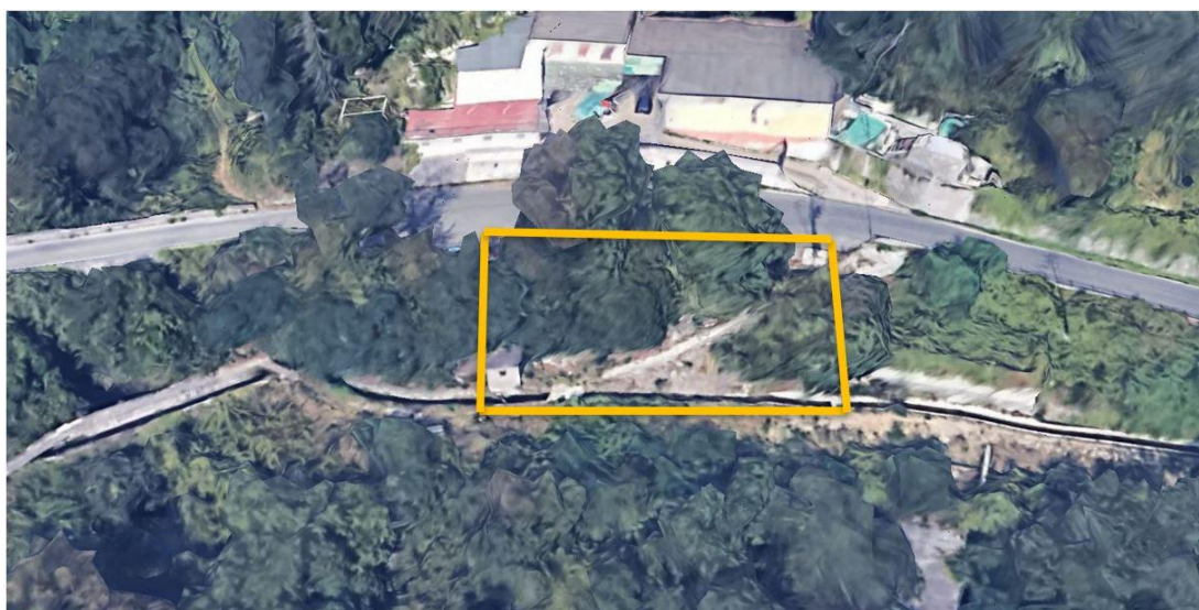
Figura 2 – ulteriore rappresentazione di massima delle aree e del volume tecnico dell'acquedotto interdetti