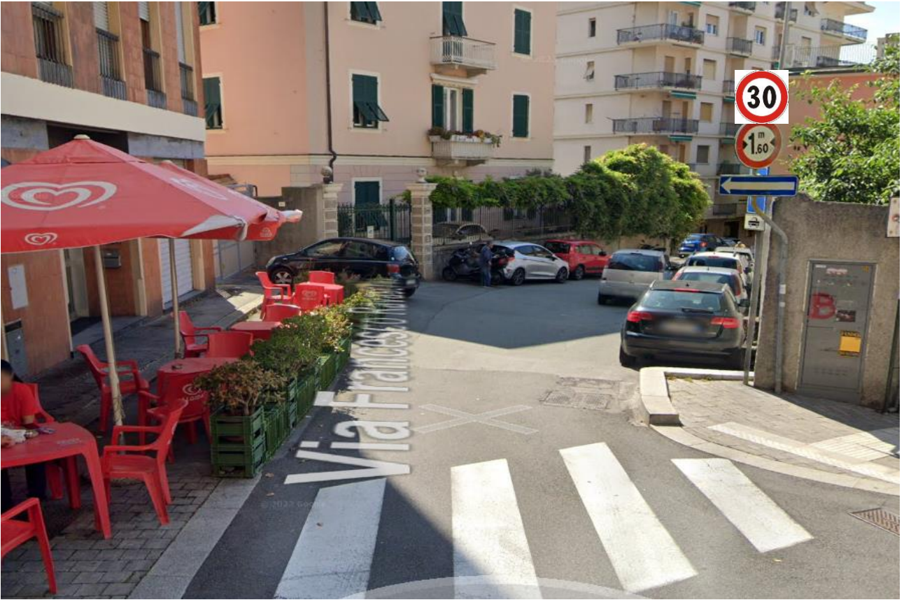
Via Ravaschio intersezione Viale Canepa installare 30 Km/h