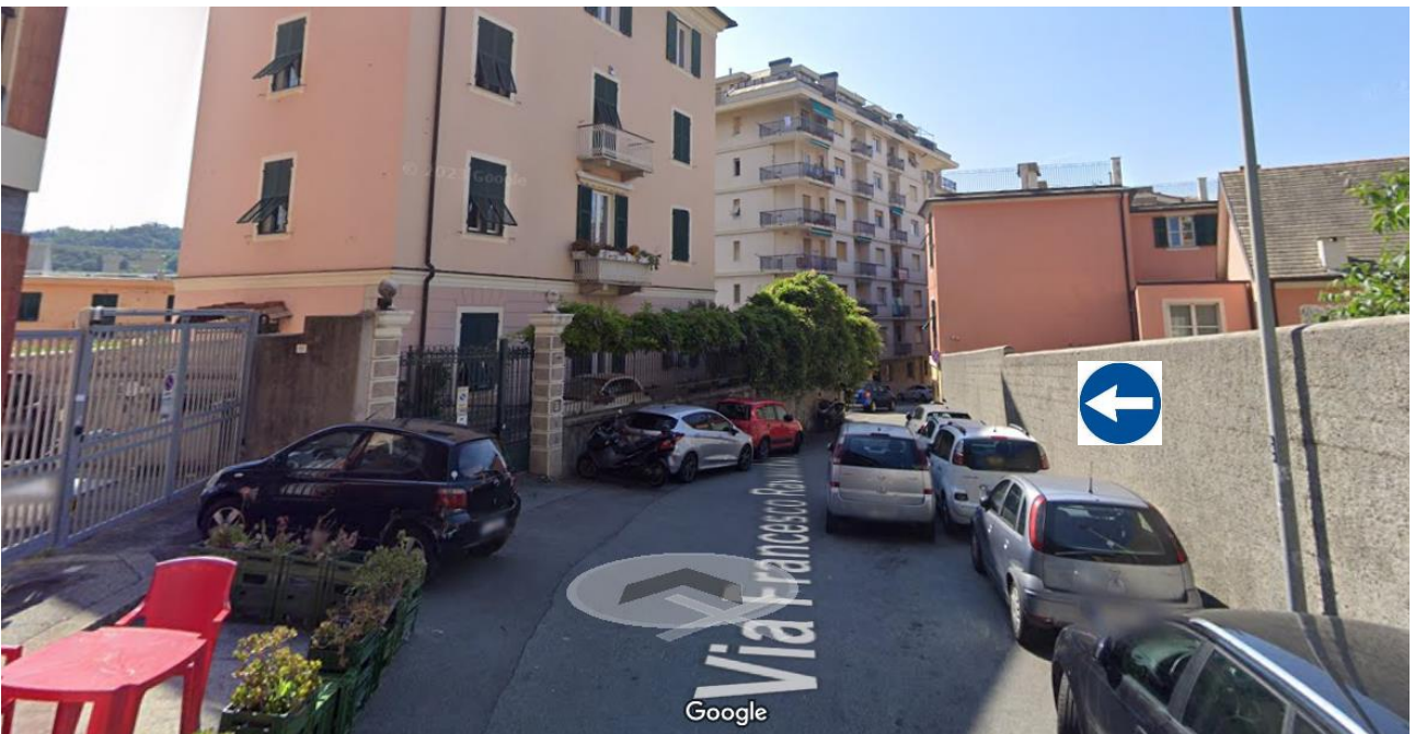
Via Ravaschio 109 installare direzione obbligatoria a sx