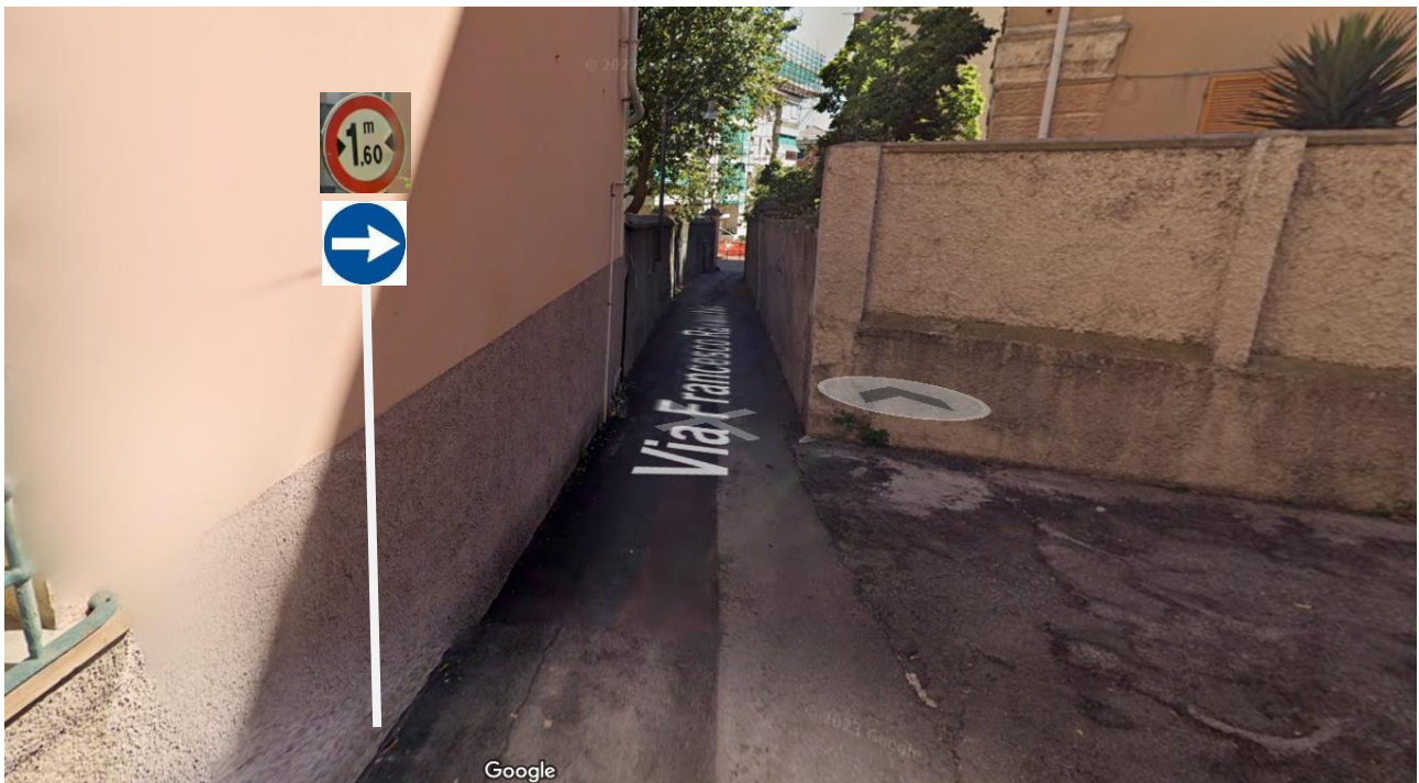
Via Ravaschio 12 installare direzione obbligatoria a dx e transito vietato ai veicoli con larghezza superiore a m 1,60 visibile dai veicoli in uscita dal passo carrabile