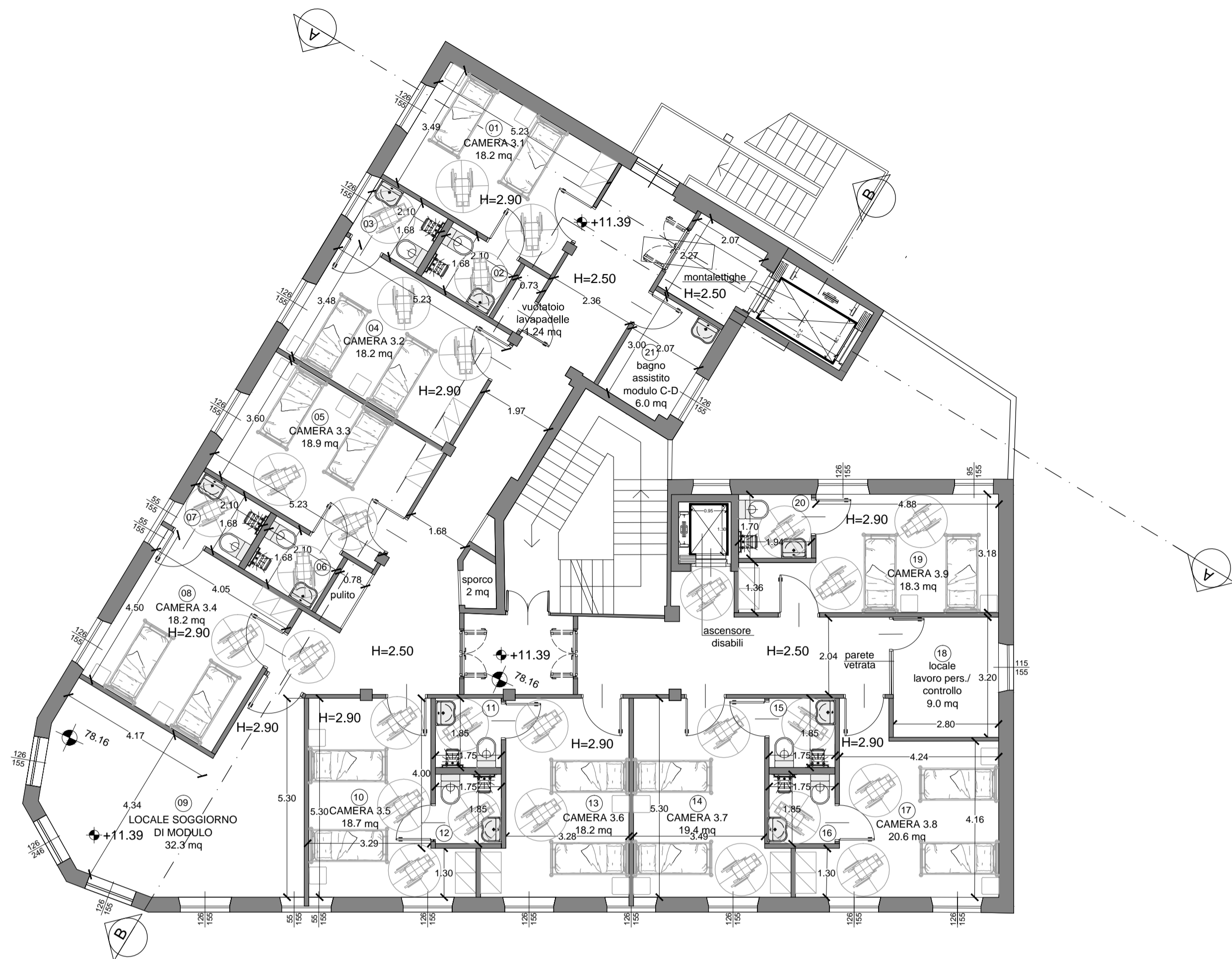
Pianta piano terzo