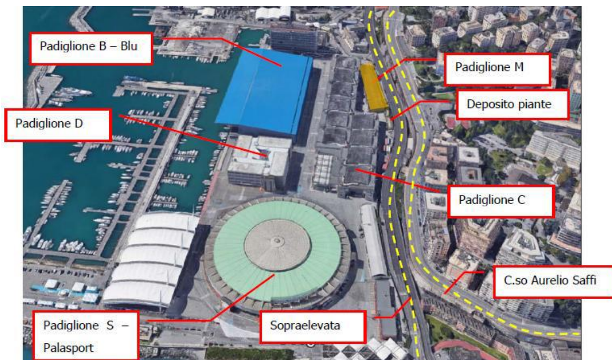
Ubicazione padiglione M su base fotografica contenente i padiglioni C e D oggi demoliti

A differenza di quanto indicato nel PMA approvato per l'appalto "Demolizioni padiglioni C e D", viste le contenute dimensioni del padiglione M oggetto di demolizione, si propone la soppressione della stazione 3 (ubicata in area ex padiglione D "Ingegneria") e lo spostamento della stazione 2 in adiacenza al padiglione M. Si riporta di seguito la localizzazione delle stazioni da PMA approvato per la demolizione dei padiglioni C e D e la proposta di ubicazione stazioni per la demolizione del padiglione M.