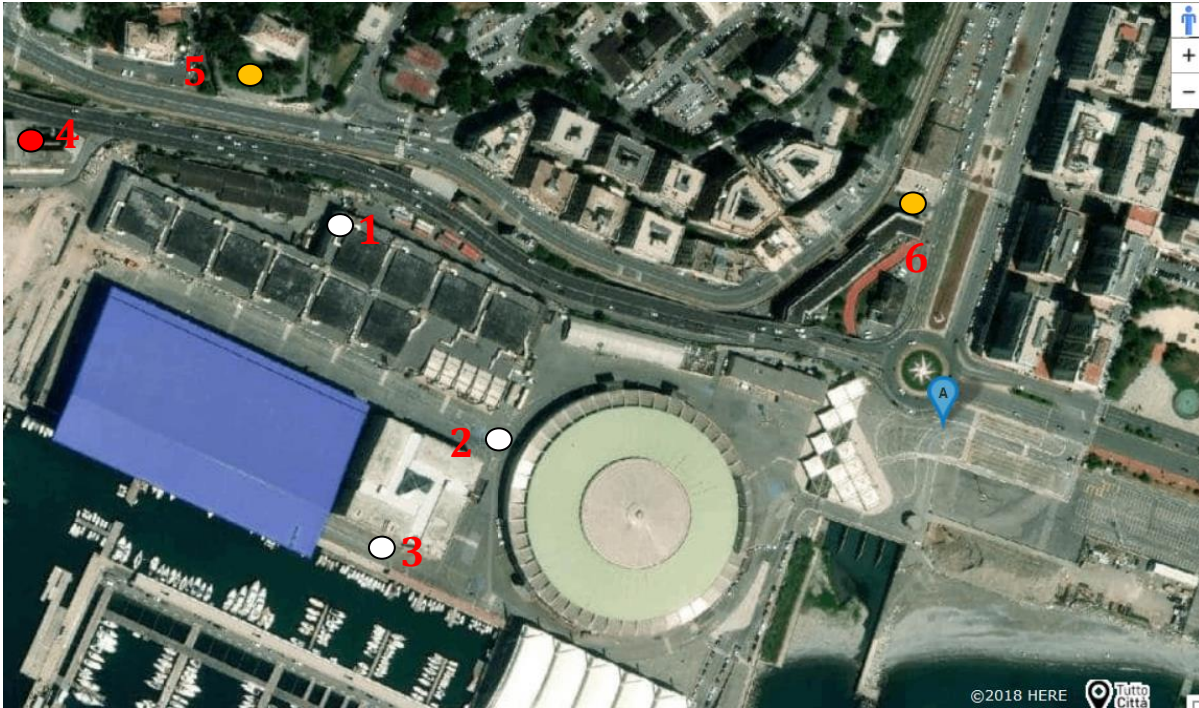
Mappa area di interesse con piazzamento stazioni di monitoraggio da PMA approvato per appalto "Demolizione padiglioni C e D"