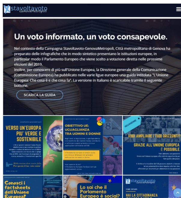
Figura 1 - una vista del contenitore digitale per il progetto #stavoltavotogenovametropoli accessibile all'indirizzo http://bit.ly/voteEE2019

In vista delle elezioni Europee del prossimo 23-26 Maggio 2019, la Città Metropolitana di Genova, quale ente di coordinamento del territorio metropolitano, ha deciso di farsi promotrice di una iniziativa di sensibilizzazione della cittadinanza, anche condividendo esperienze e conoscenze tecnologiche.