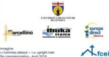
Immagine: Les hommes debout – the upright men 25 e commémoration - Avril 2019 murale permanente, Bruxelles

A cura del gruppo di lettura "Genova Voci"