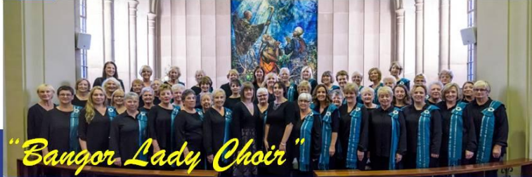
"Bangor Lady Choir"