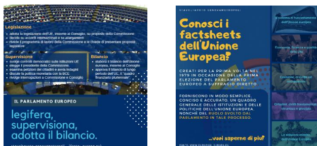
Figura 2 - Alcuni esempi di infografiche prodotte. Per visualizzare tutte le infografiche e le interviste si visiti il sito di progetto