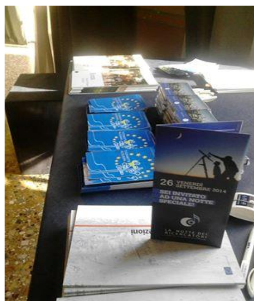
European Corner edizione 2014

Tutti gli eventi sono ad ingresso gratuito. Per il programma completo è consultabile il sito: http://nottedeiricercatori.comune.genova.it