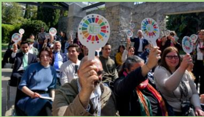
Parchi di Nervi