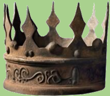
BRONZE SPONSOR –2K