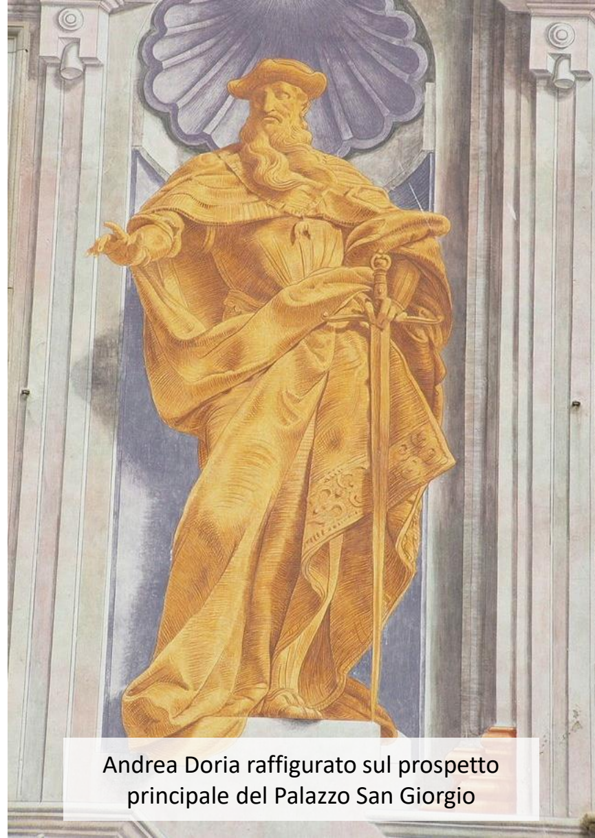
Andrea Doria raffigurato sul prospetto principale del Palazzo San Giorgio

Il Confeugo di quest'anno vuole quindi celebrare la figura e l'opera di Andrea Doria, e il suo legame con il medioevo genovese