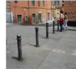
Via Tolleto / Via Galata

Paletto (N° 22) Autorizzato da: Ministero Infrastrutture e Trasporti Direzione Generale Sicurezza Stradale Prot. 0005168-30/10/2014