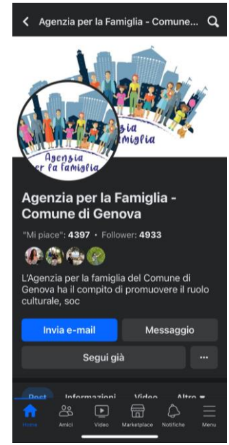
Pagina Facebook Agenzia per la Famiglia