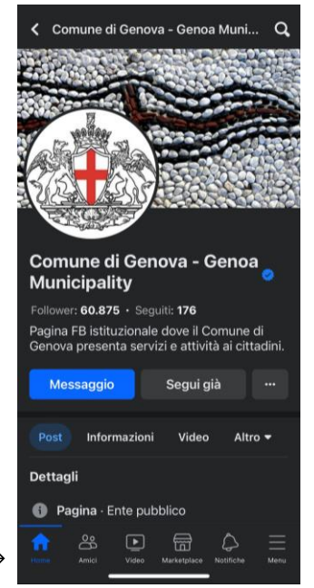
Pagina Facebook Comune di Genova