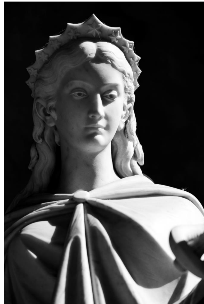
Tomba Chiappella Dekat, Domenico Carli

Staglieno non è solo il luogo della memoria, ma è occasione di incontro con arte, storia, cultura, alla ricerca dell'identità.