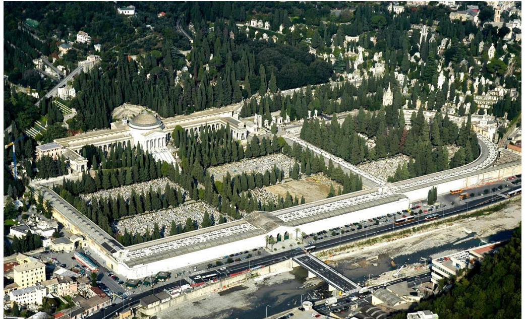
Cimitero Monumentale di Staglieno, panoramica

È un'occasione importante di conservazione e valorizzazione del patrimonio artistico e culturale della città e di promozione del Cimitero di Staglieno nei suoi aspetti e storici, architettonici.