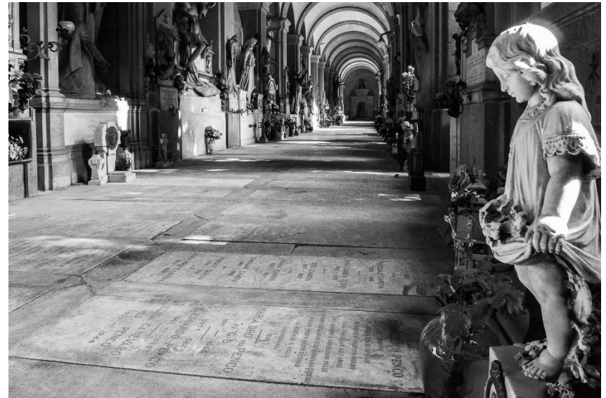
Porticato Quadrangolare

Al suo interno meravigliosi monumenti funebri raccontano Genova dalla Seconda Metà dell'Ottocento al Novecento: dalla ricca borghesia ottocentesca ai patrioti del Risorgimento, dai caduti della Grande Guerra agli eroi della Resistenza al nazifascismo, fino ad arrivare a personaggi della cultura, della musica, della politica cittadina. Camminare per le sue gallerie è come sfogliare un libro di storia.