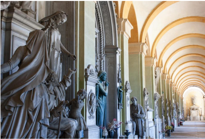
Porticato quadrangolare

i porticati quadrangolare e semicircolare, i porticati superiori accanto al Pantheon, il Boschetto irregolare.