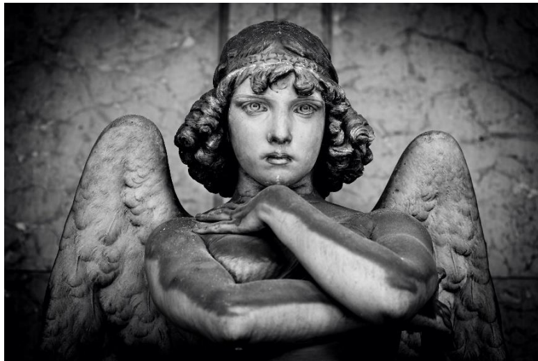
Tomba Oneto, Giulio Monteverde