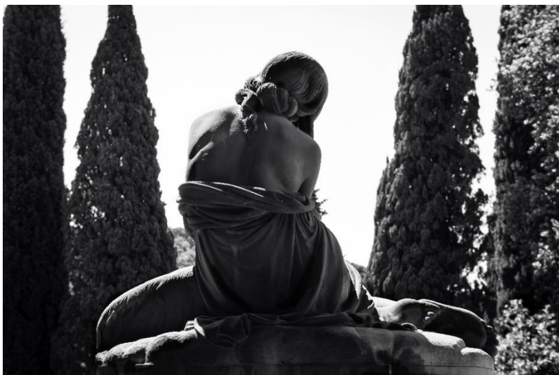
Tomba Paradis

La sponsorizzazione di restauri o manutenzioni delle parti comuni del Cimitero Monumentale di Staglieno offre all'azienda la possibilità di inserirsi in un percorso di valorizzazione del patrimonio culturale e artistico della città andando anche a intercettare tutti quei cittadini che usufruiscono del Cimitero come utenti e sono interessati al decoro e alla bellezza del luogo dove riposano i loro cari.