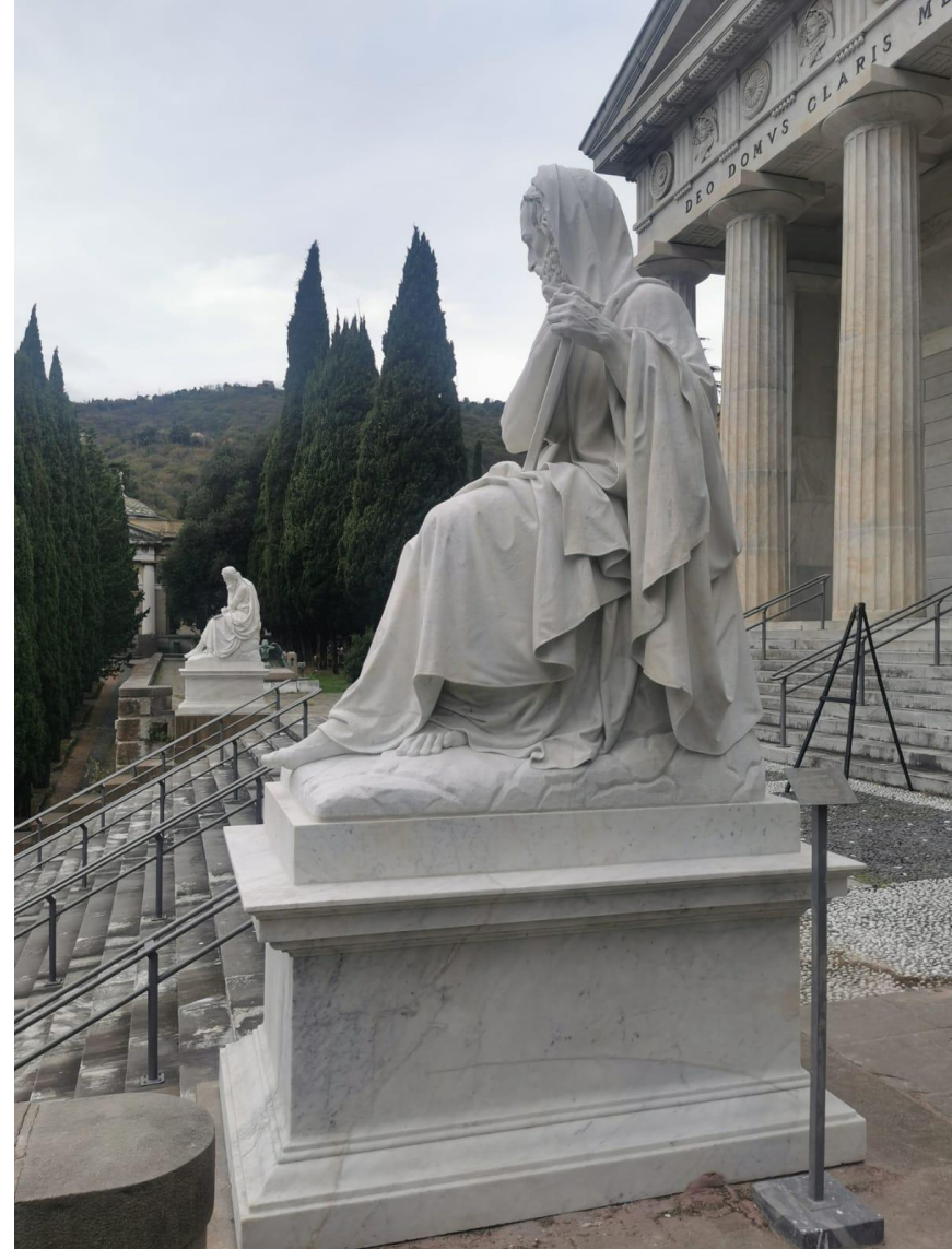
Restauro Statue di Giobbe e Geremia, 2020