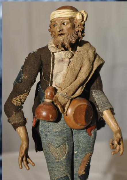
GENOVA Secolo XVIII