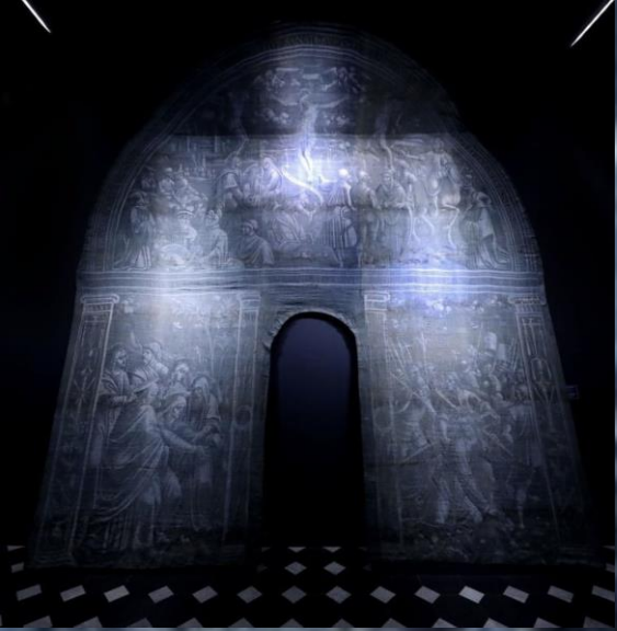
GENOVA 1538 ca.