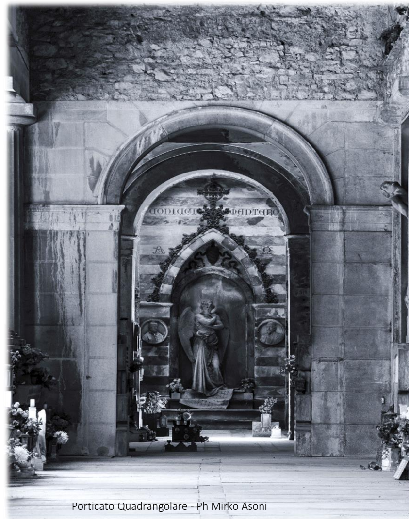
Porticato Quadrangolare

Il Cimitero Monumentale di Staglieno non è solo il luogo della memoria, ma è occasione di incontro con arte, storia, cultura, alla ricerca dell'identità nella riscoperta delle proprie origini.