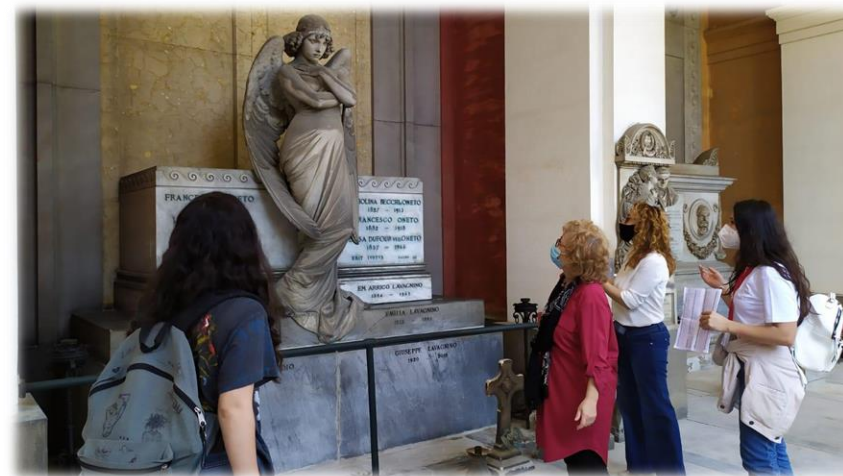
Visita guidata - Ph Genovafa