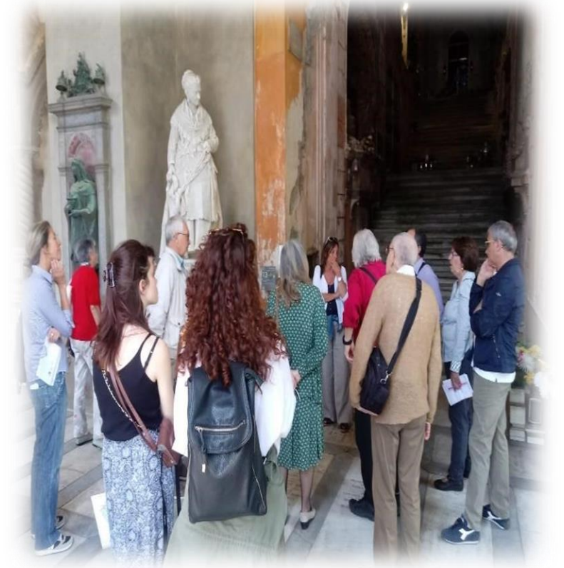
Visite guidate 2021