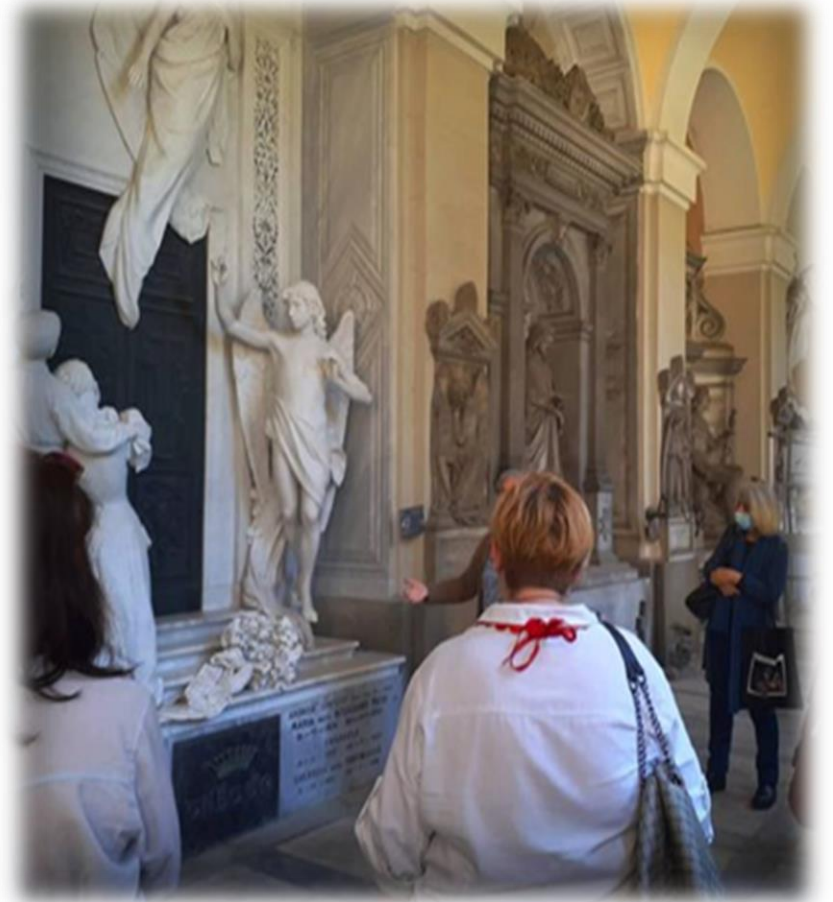
Visite guidate 2021