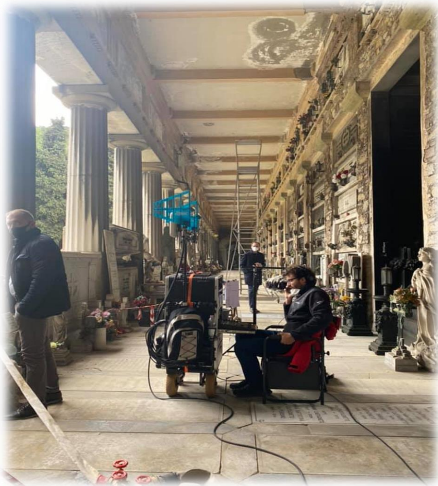
Set cinematografico all'interno del Cimitero di Staglieno

Oggi, grazie anche alla visibilità che sta acquisendo sui media (location per fiction, servizi giornalistici e fotografici nazionali e internazionali), il Cimitero Monumentale ha raggiunto una considerevole notorietà ed è richiesto come destinazione di visite guidate in misura crescente.