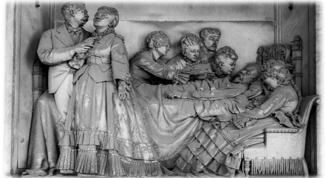
Tomba Raggio, Augusto Rivalta

Al suo interno meravigliosi monumenti funebri raccontano Genova dalla Seconda Metà dell'Ottocento al Novecento: dalla ricca borghesia ottocentesca ai patrioti del Risorgimento, dai caduti della Grande Guerra agli eroi della Resistenza al nazifascismo, fino ad arrivare a personaggi della cultura, della musica, della politica cittadina. Camminare per le sue gallerie è come sfogliare un libro di storia.