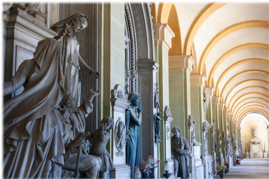
Porticato quadrangolare