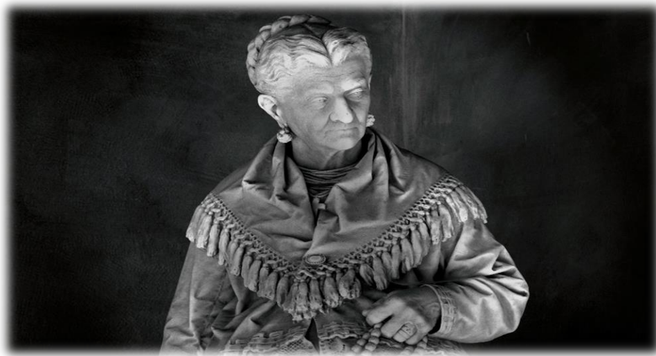
Tomba Campodonico, Lorenzo Orengo