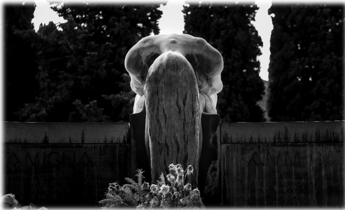
Tomba Ammirato, Edoardo De Albertis