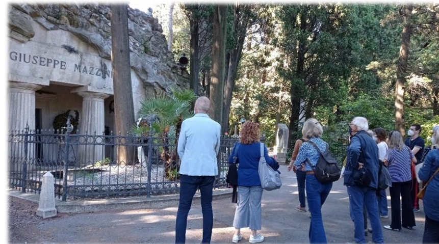
Visita guidata

i porticati quadrangolare e semicircolare, i porticati superiori accanto al Pantheon, il Boschetto irregolare e la zona delle cappelle novecentesche.