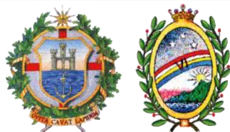
MUNICIPIO VI MEDIO PONENTE