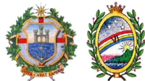
MUNICIPIO VI MEDIO PONENTE