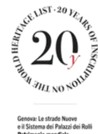
Genova: Le strade Nuove e il Sistema dei Palazzi dei Rolli Patrimonio mondiale