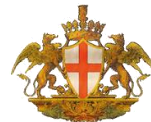
COMUNE DI GENOVA