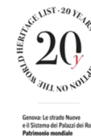
Genova: Le strade Nuove e il Sistema dei Palazzi dei Rolli Patrimonio mondiale