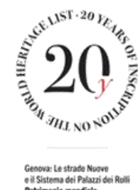
Genova: Le strade Nuove e il Sistema dei Palazzi dei Rolli Patrimonio mondiale