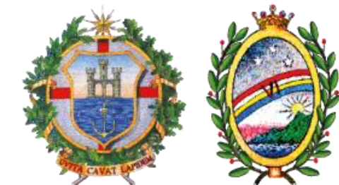
MUNICIPIO VI MEDIO PONENTE