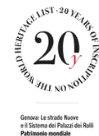
Genova: Le strade Nuove e il Sistema dei Palazzi dei Rolli Patrimonio mondiale