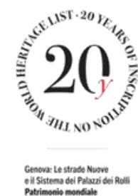
Genova: Le strade Nuove e il Sistema dei Palazzi dei Rolli Patrimonio mondiale