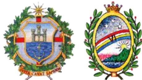
MUNICIPIO VI MEDIO PONENTE