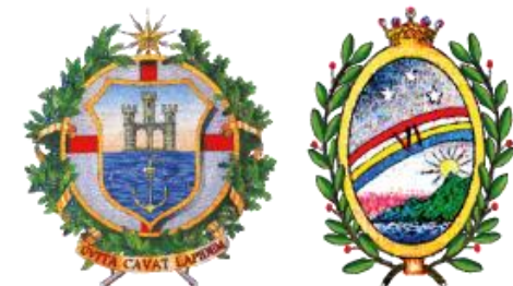
MUNICIPIO VI MEDIO PONENTE