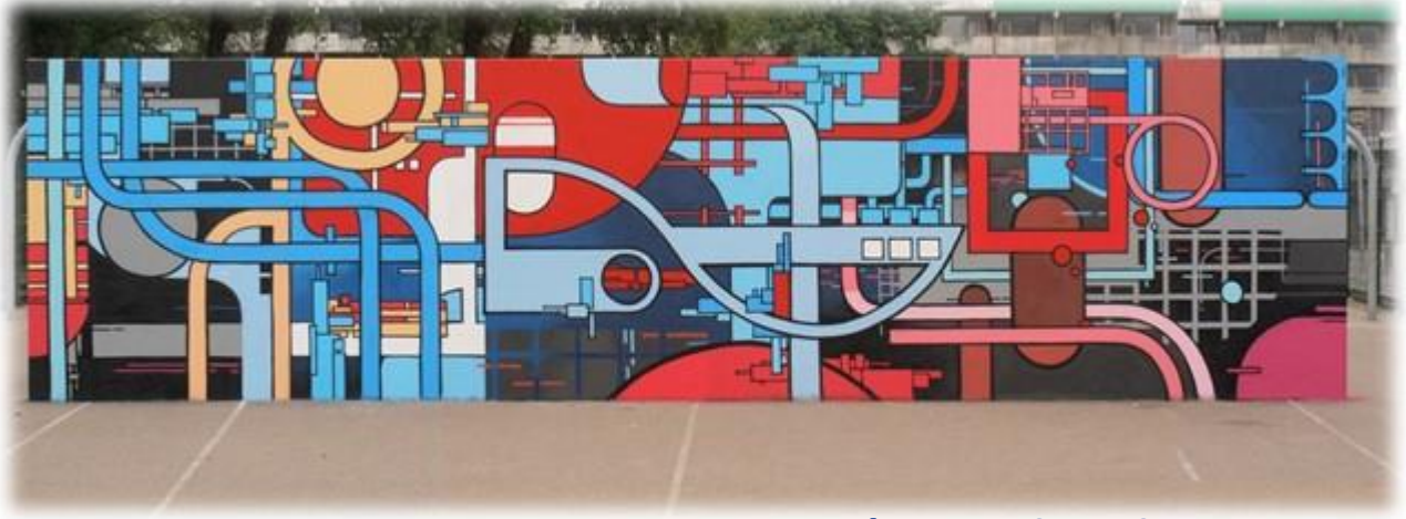
Un'opera di Zedz