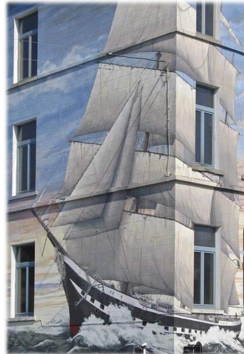
(in foto un intervento realizzato in un'altra città)