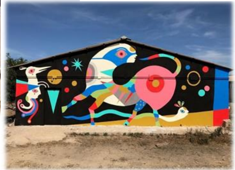
Un'opera di Gio Pistone

Alcuni esempi di opere Realizzate in altre città