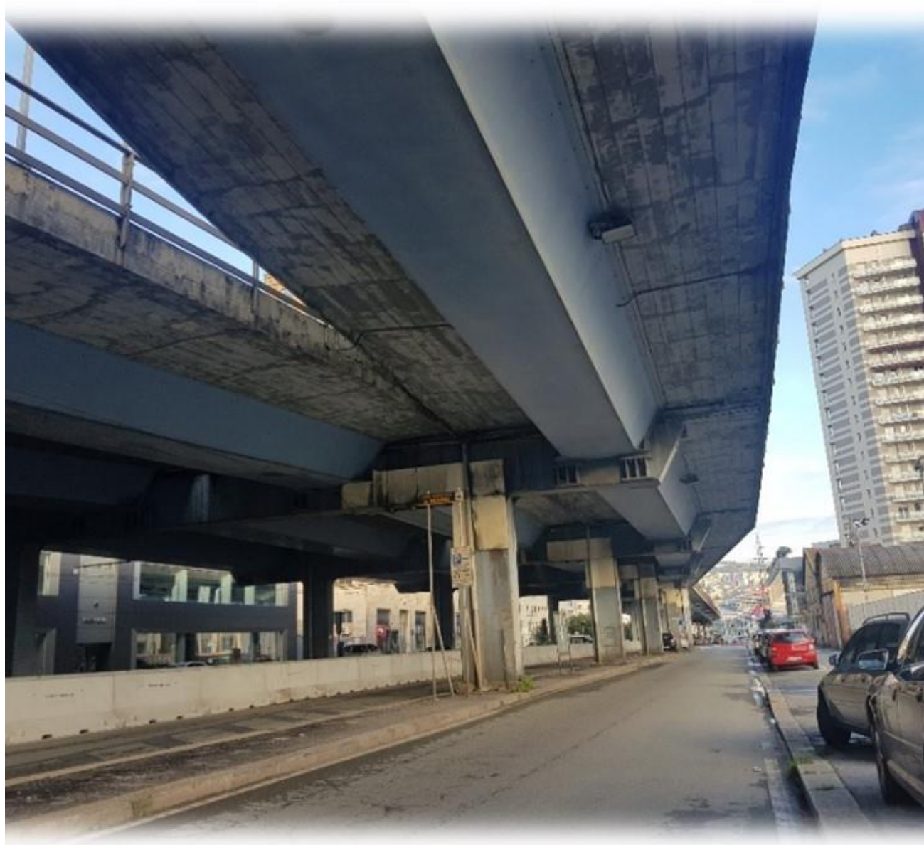
VIA DI FRANCIA