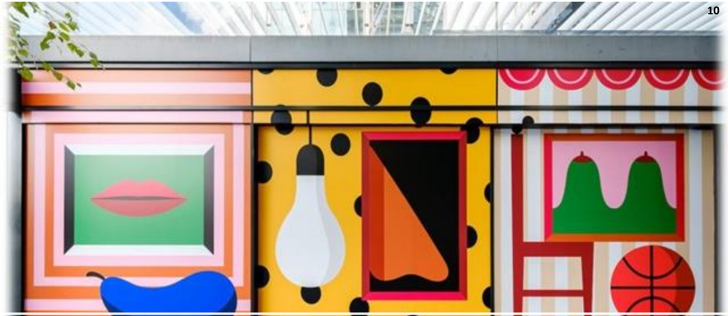
Esempio: un'opera di Agostino Iacurci