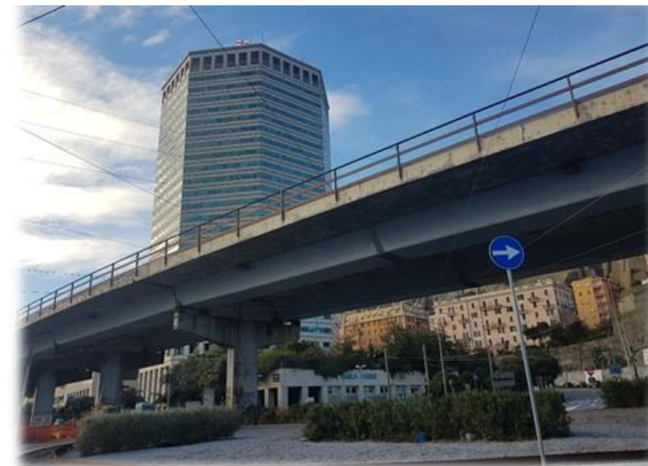
VIA MILANO – TERMINAL TRAGHETTI