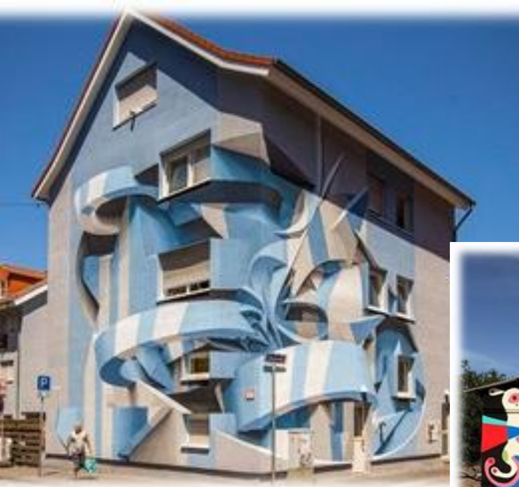
Un'opera di Peeta