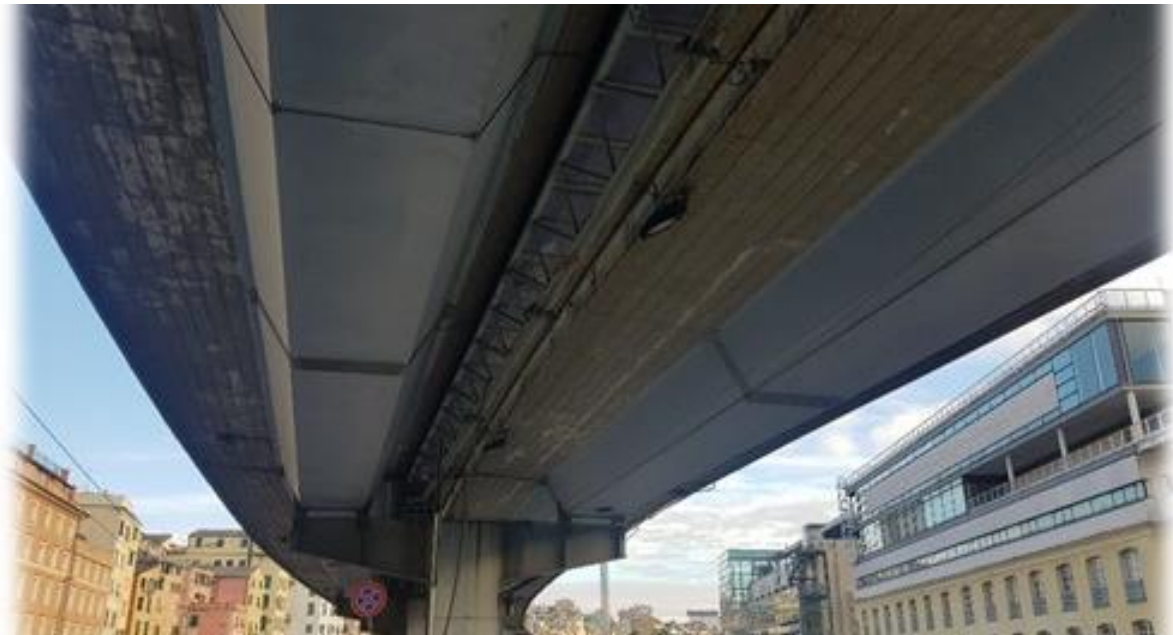
VIA GRAMSCI – GALATA MUSEO DEL MARE