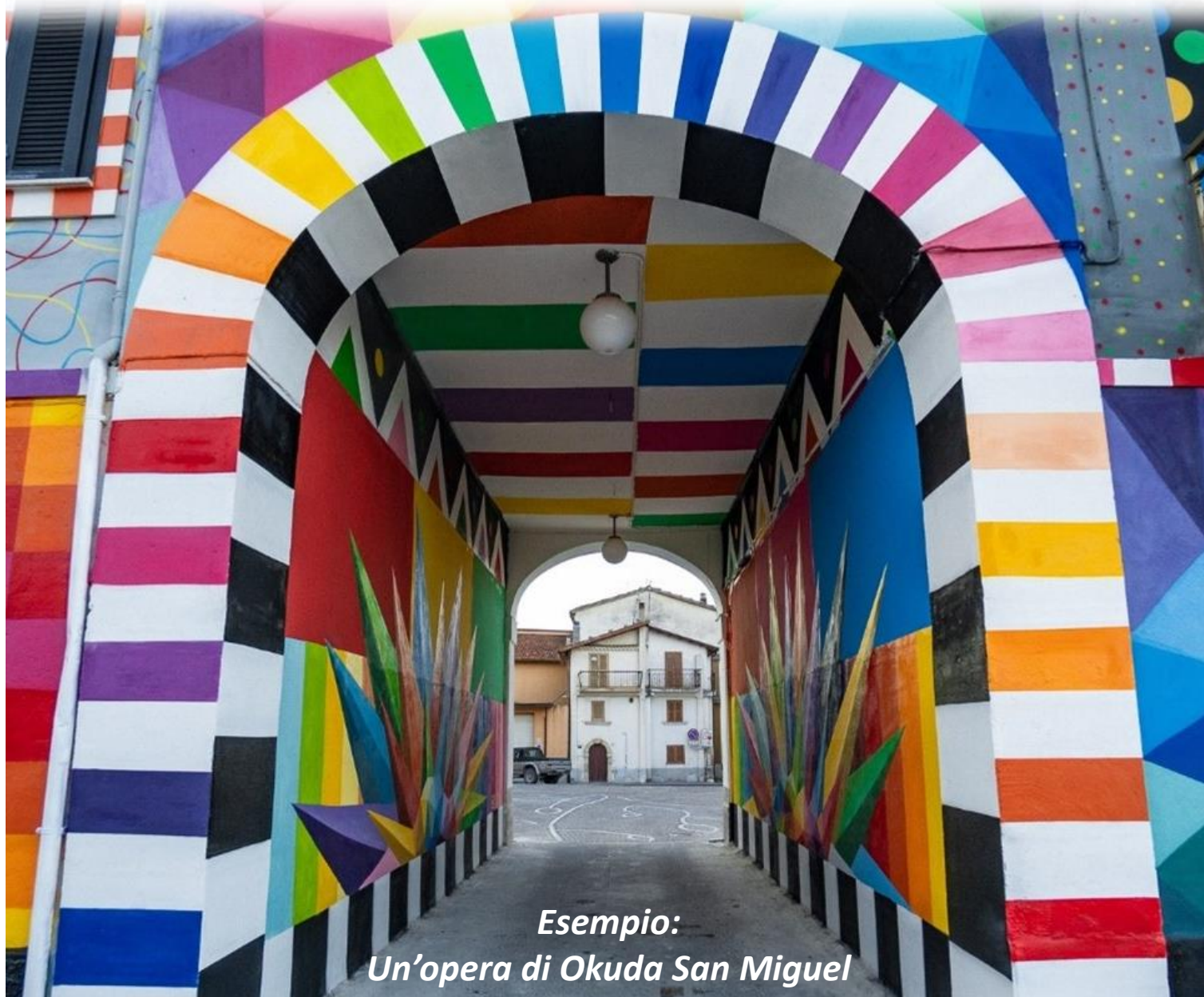
Esempio: Un'opera di Okuda San Miguel

Le possibilità dell'astrattismo sono realmente infinite e sono numerosissimi gli artisti che praticano questo tipo di figurazione.