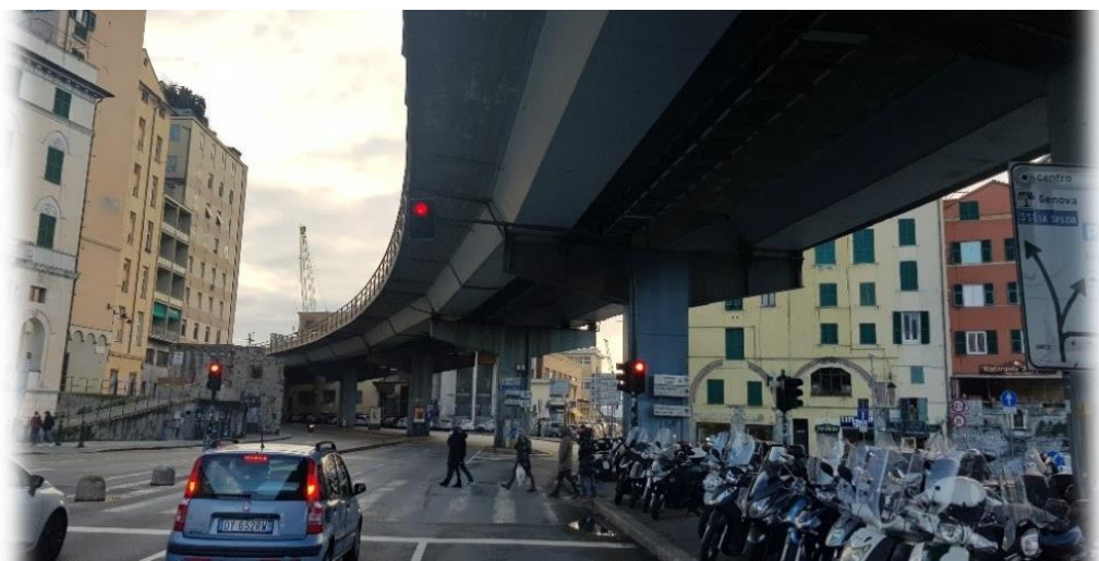
CARICAMENTO – INGRESSO PORTO ANTICO