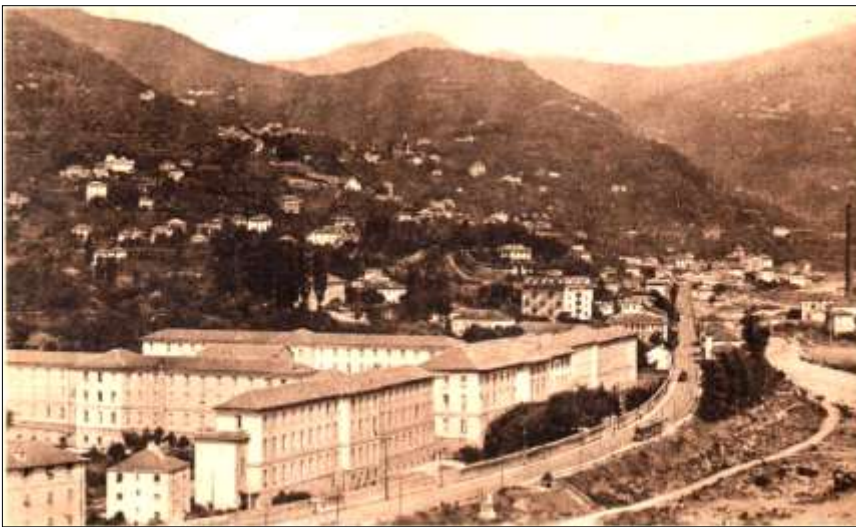
Struppa, 1940 circa