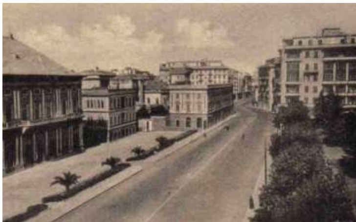
Via Cantore Sampierdarena