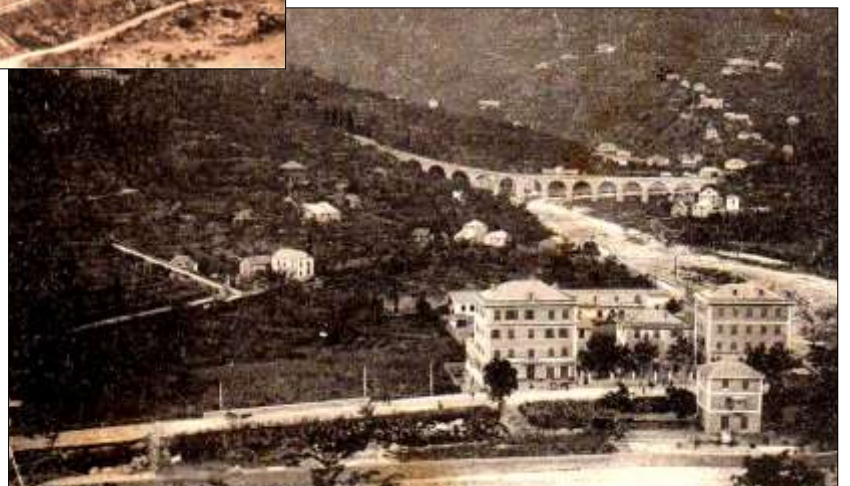
Panorama di Molassana