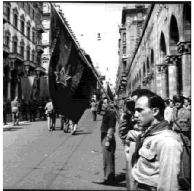
Via XX Settembre e Piazza De Ferrari, Genova

attivamente preso parte alle questioni politiche e sociali, il cui ruolo impegnato socialmente culminò con l'estensione del diritto di voto del 1° febbraio 1945. Diverse donne partigiane furono decorate con la medaglia d'oro al valore militare ma, nonostante ciò, molte di loro furono tradite proprio da quegli uomini con cui avevano condiviso ideali e valori politici in quanto, secondo la mentalità dominante, avrebbero trasgredito la vocazione domestica.