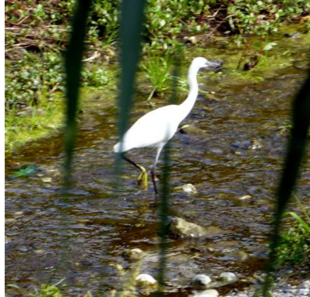
Il bio-parco di San Biagio