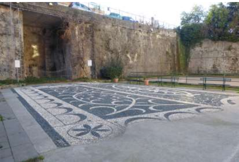
Relitti rurali e frammenti antichi